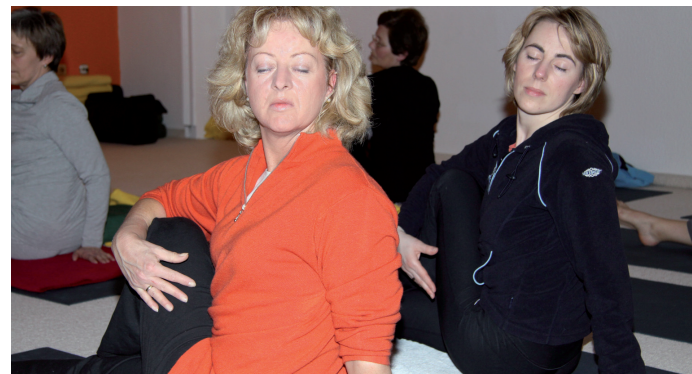
Yogaübung – Der Drehsitz