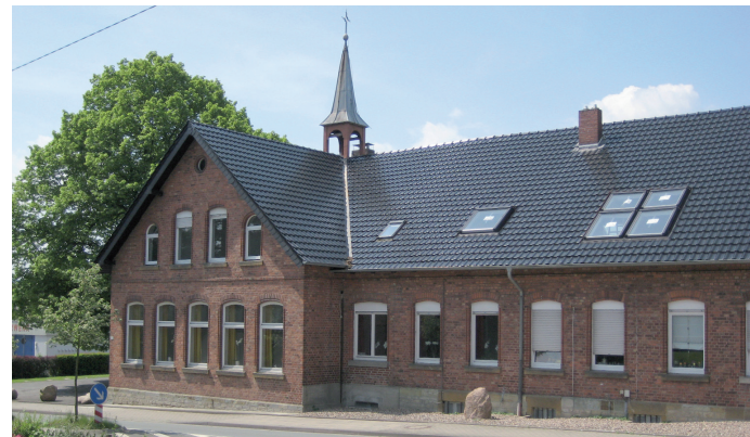
Das Bildungszentrum Alte Schule in Deppendorf